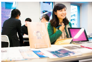
企業と学生の面談中の様子

「逆求人フェスティバル」とは、就活生側がブースを作り、経営者や採用担当者から直接“スカウト”される、通常と合同説明会とは「逆」の形式を用いた就職活動イベントです。