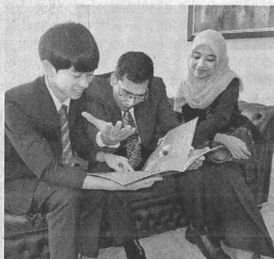
14日、リクルートキャリアがシンガポールで開いた合同面接会で面接の最終準備をする学生ら

人材各社がアジアで現地の新卒採用の支援事業を広げる。リクルートキャリア(東京・千代田)やパソナグループなどは、東南アジア諸国連合(ASEAN)で日本企業の合同説明会や選考会を拡大、外国人学生との接点を増やす。ジースタイル(同)は中国で中小企業向けの学生紹介を始める。企業の海外展開加速によるグローバル人材の需要増に現地での新卒人材の発掘で対応する。